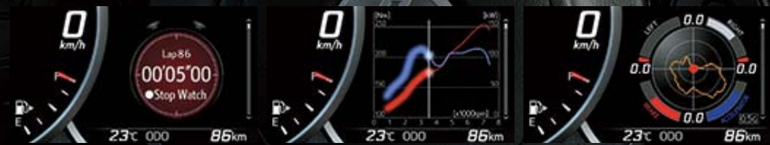
شاشة ساعة الإيقاف Stop watch screen

A 4.2-inch TFT (Thin Film Transistor) meter display* enhances your interactivity with Toyota 86 while enjoying a sportier, more exciting drive. Along with showing the core information expected of a sports car, the display lets you switch visual content according to your preferences. * Available on HIGH AT/MT grades.