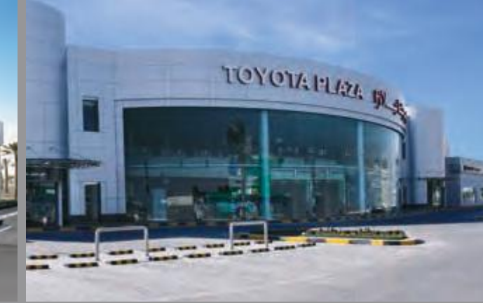
The Benchmark in After-sales Services