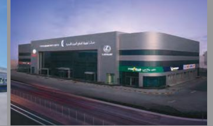
100% Available Genuine Parts