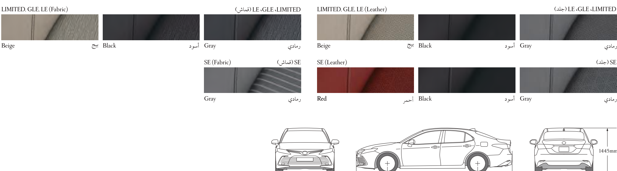
ملاحظة: يُرثى الاستفسار لدى الوكيل المحلي حول مدى توفّر مجموعات الألوان.

Note: Please inquire at your local dealer for color combination availability.